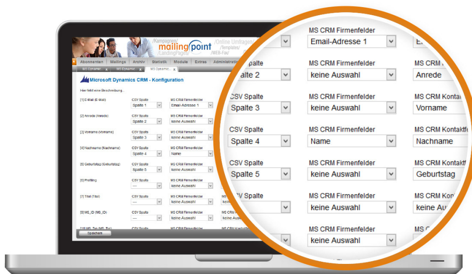
Mapping der CRM-Datenstruktur per Einfachauswahl

Binden Sie zukünftig Ihre Kundendaten mithilfe unserer Microsoft Dynamics CRM-Schnittstelle schnell und einfach in mailingpoint ein. Unsere Schnittstelle kommuniziert dabei per Webservice mit Ihrem cloud-basierten CRM-System, das heißt Änderungen im CRM werden automatisch von der Schnittstelle erfasst und in Ihren mailingpoint-Abonentendaten aktualisiert.